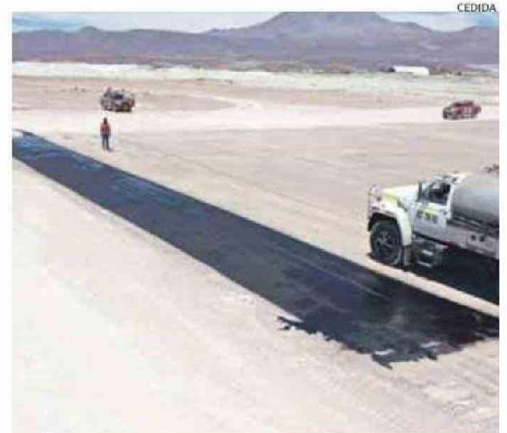
TRABAJOS PARA HABILITAR LA POSADA DE HELICÓPTERO EN OLLAGÜE.