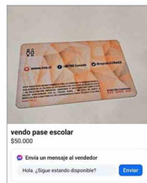
La TNE es comercializada a través de internet, al igual que sus sellos.

de la Escuela de Ingeniería de Construcción y Transporte de la Pontificia Universidad Católica de Valparaíso, explica que "muchos estudiantes pasan la tarjeta a familiares, y por eso se hacen más viajes durante el día. Además, hay gente que está ven-