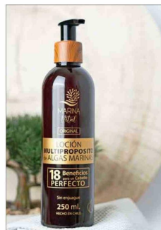
Loción multipropósito de algas marinas, el producto central de Marina Vital.