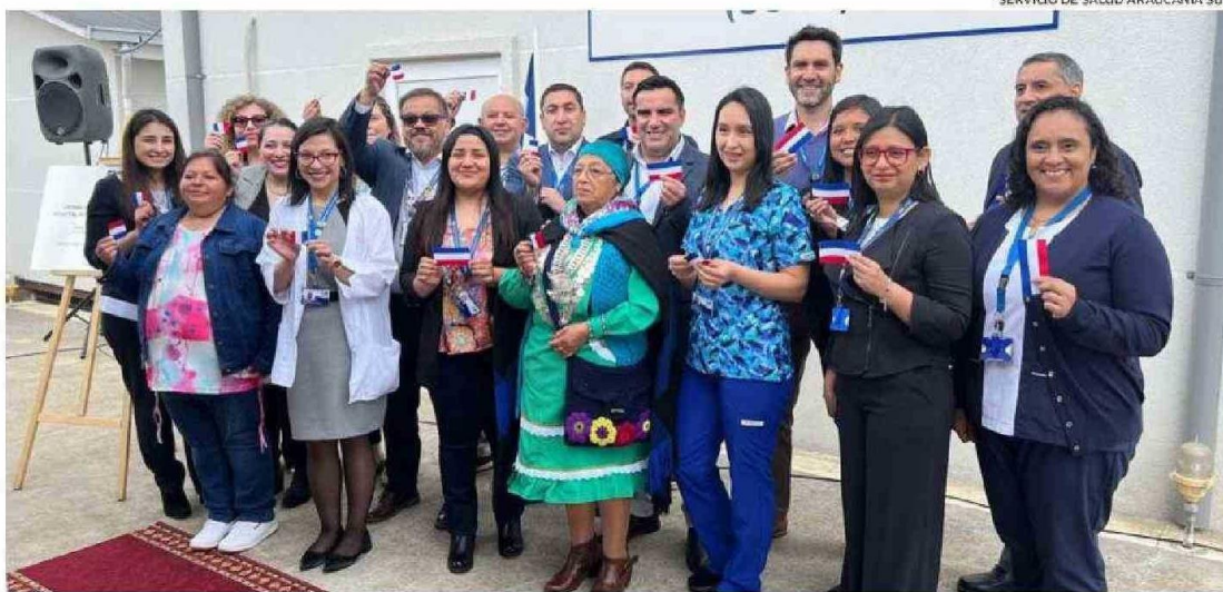
CADA INTEGRANTE TIENE DISTINTAS FUNCIONES QUE TIENEN COMO FOCO PRINCIPAL EL BIENESTAR DEL PACIENTE EN EL ÁMBITO BIOMÉDICO, PERO TAMBIÉN FUNCIONAL Y SOCIAL.

Cada integrante tiene distintas funciones que tienen como foco principal el bienestar del paciente en el ámbito biomédico, pero también funcional y social, vinculado a la APS para garantizar la continuidad de la atención en ámbitos como salud cardiovascular, salud mental, programa del adulto mayor, etcétera.