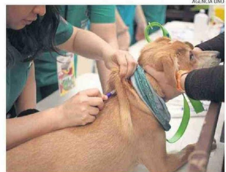
LA SUBDERE GESTIONA ESTERILIZACIONES GRATUITAS EN LAS COMUNAS.

educación sobre la tenencia responsable de mascotas en la comunidad. Las mordeduras de perros representan un problema constante de salud pública en la región de Atacama, con una alta frecuencia de casos en diversas comunas y una tendencia sostenida en el tiempo".