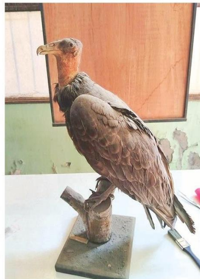
Jote, ave carroñera chilena.