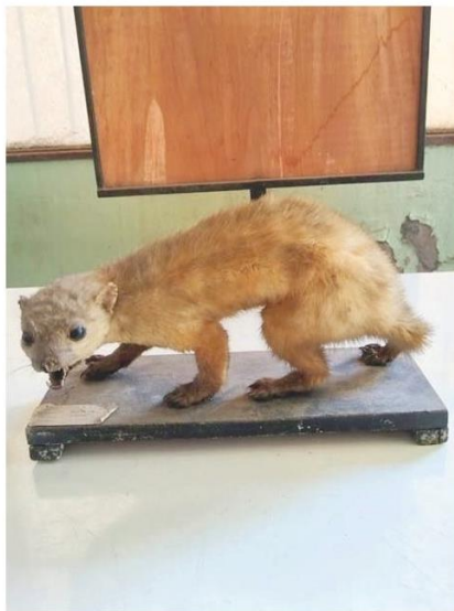
Marta, mamífero carnívoro apreciado por su piel.