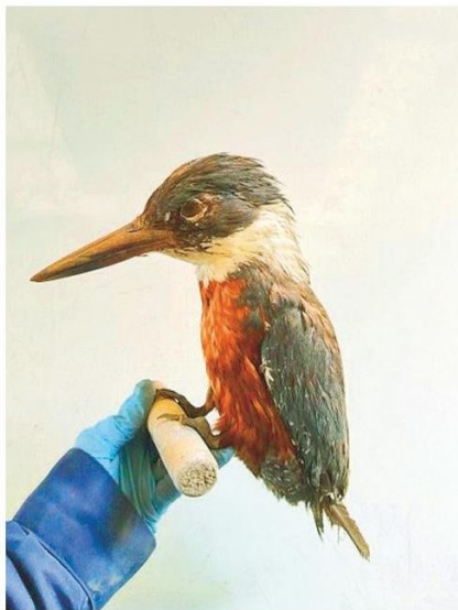
Martin Pescador, ave de distintas tonalidades que puede cazar bajo el agua.