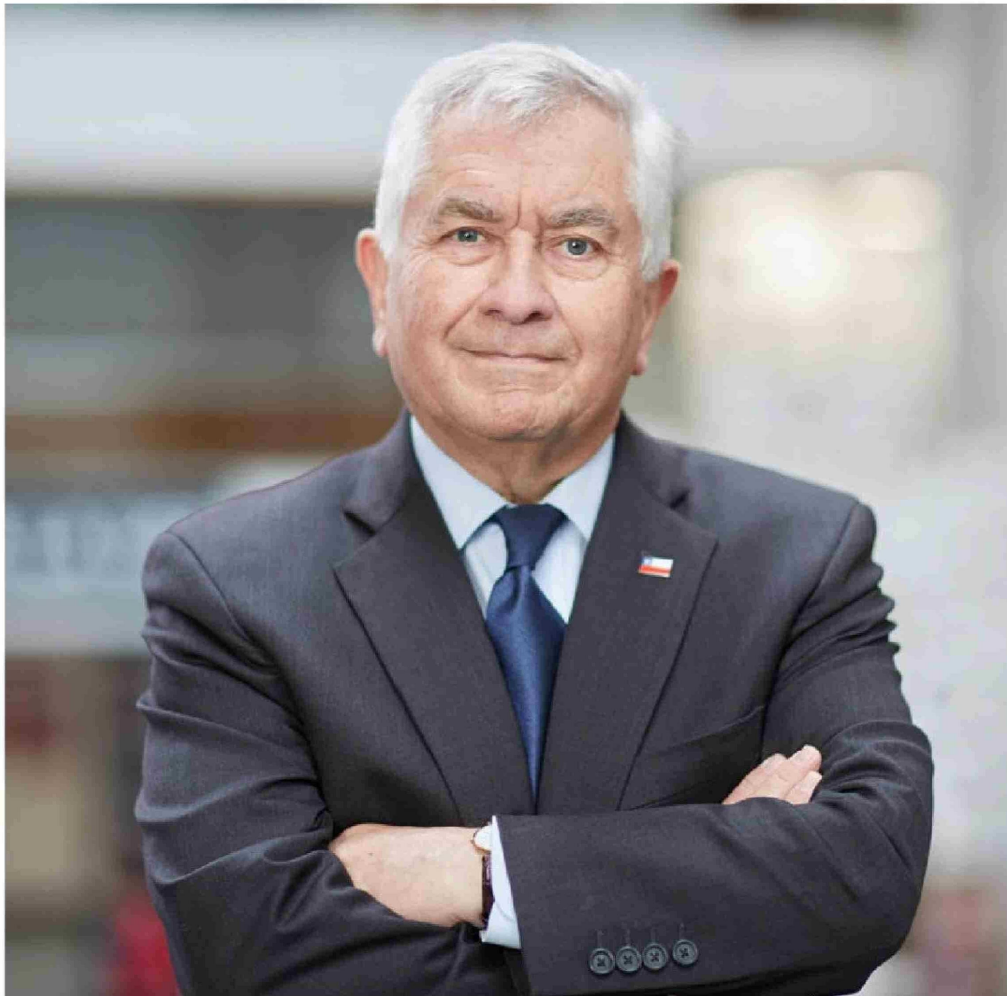
► El exministro de Salud de Sebastián Piñera, Enrique Paris, asumió la cartera 102 días después de la llegada del virus a Chile.