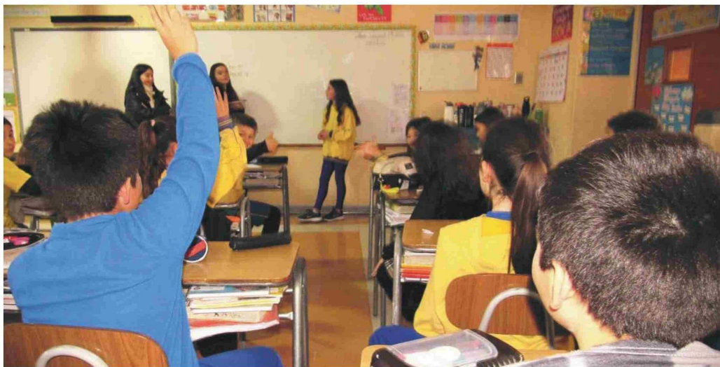
Estudiantes de diversas edades de Coquimbo y Atacama fueron partícipes de esta valiosa actividad organizada por The International School La Serena.

La jornada comenzó a las 8:30 horas con una interesante exposición del director de Diario El Día, Francisco Puga Medina, quien analizó junto a los jóvenes, el rol de las noticias en la opinión pública regional y del país, contextualizado en los 80 años del medio.