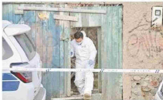
Al ingresar a la propiedad de Eusebio Lillo N°1291, personal de la PDI encontró a las dos mujeres fallecidas.