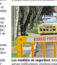
Las medidas de seguridad deben involucrar un esfuerzo mancomunado entre diversas instituciones, plantean especialistas.

Añade que "luego la estrategia debe considerar incentivos económicos para las familias y municipios para la reinserción escolar de jóvenes desahucados, instalación de 'oficinas de oportunidades laborales' de cooperación público-privada para dar trabajos lícitos a jóvenes y adultos".