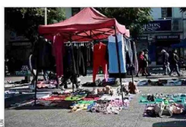
DERRUIDOS.— Sectores de la capital como Meiggs o la Vega Central se han deteriorado de la mano de la actividad informal.

Con distintos tipos de medidas, que van desde equipos de fiscalización hasta el aumento de permisos municipales, algunas autoridades han buscado enfrentar el fenómeno del comercio ambulante, que prolifera en barrios comerciales de las distintas ciudades.