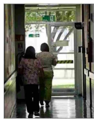
Actualmente, hay 2,5 millones de prestaciones atrasadas.

Otra propuesta, indica Sánchez, es "flexibilizar en forma inteligente la gestión médica para incentivar el trabajo fuera de horarios normales, sujeto a normas e incentivos claros y bien gestionados y supervisados para evitar el abuso", y "resignar más recursos a establecimientos que claramente lo requieren, pero amarrados a cumplimiento de indicadores y metas, sancionando el incumplimiento".