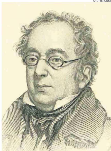
ISAAC DISRAELI PUBLICÓ “CURIOSIDADES DE LA LITERATURA” EN CUATRO TOMOS, ENTRE 1791 Y 1823.

—¿Cómo llegaron a este libro? —Yo estaba en Inglaterra y fue muy curioso, porque este era el autor más leído, más popular, una suerte de (Enrique) Lafourcade con “Palomita Blanca”, porque él hacía, lo que se llama en la tradición francesa, misceláneas. Entonces, los procesos de alfabetización que en Inglaterra fueron más rápidos por el protestantismo, al igual que en Alemania, a fines del siglo XVIII, principios del XIX, donde Disraeli escribió mientras la gente se estaba alfabetizando y quería captar cultura rápidamente, donde