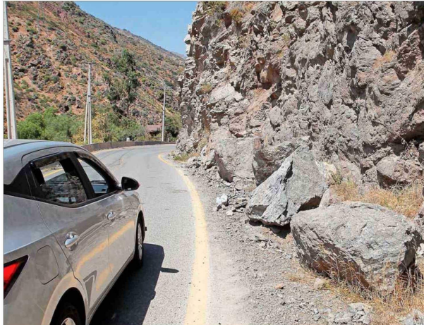
Desprendimientos de rocas de hasta 2 metros, representan un peligro.