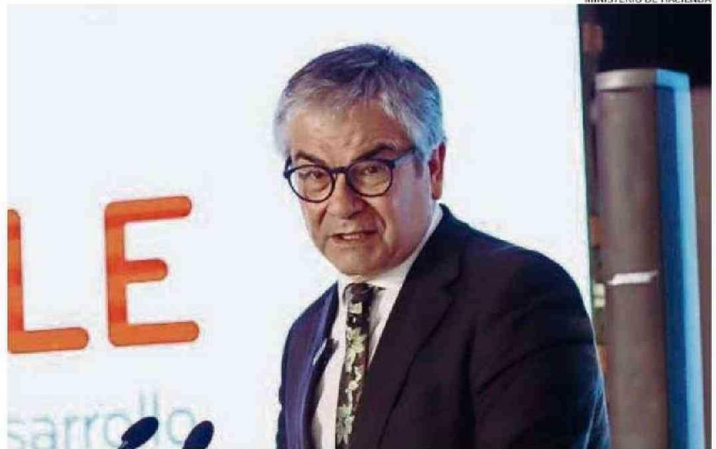
EL MINISTRO MARIO MARCEL PARTICIPÓ AYER DE UN ENCUENTRO DE LA CPC.

Marcel agregó tras el encuentro Gremios x Chile, organizado por la Confederación de la Producción y del Comercio