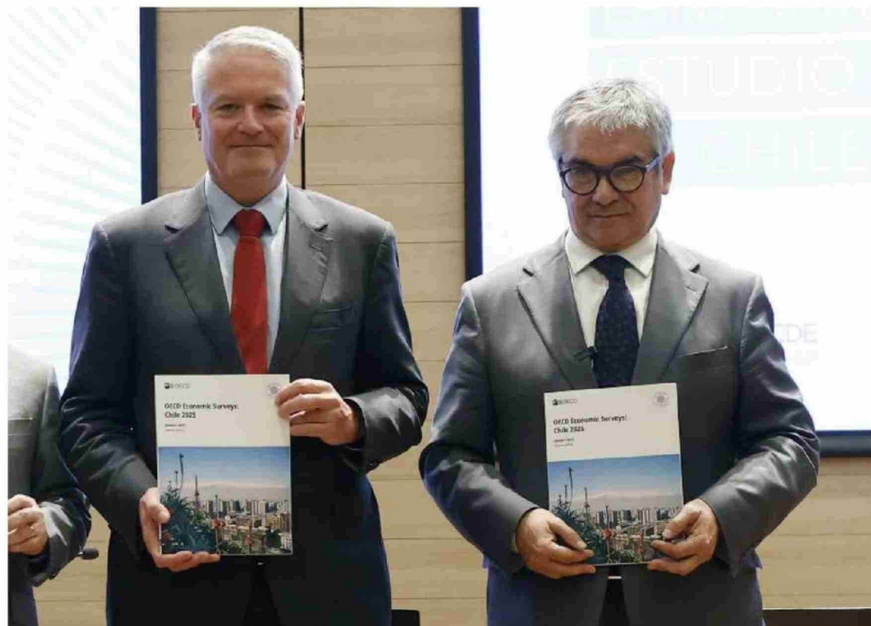
EL SECRETARIO GENERAL de la OCDE, Mathias Cormann y el ministro de Hacienda, Mario Marcel, posan durante el lanzamiento del Estudio Económico de Chile 2024, elaborado por la Organización para la Cooperación y Desarrollo Económico.

A largo plazo, dice el organismo, las perspectivas de crecimiento para Chile, que “se recuperó con mayor firmeza en 2024”, dependerán en gran medida de su capacidad para