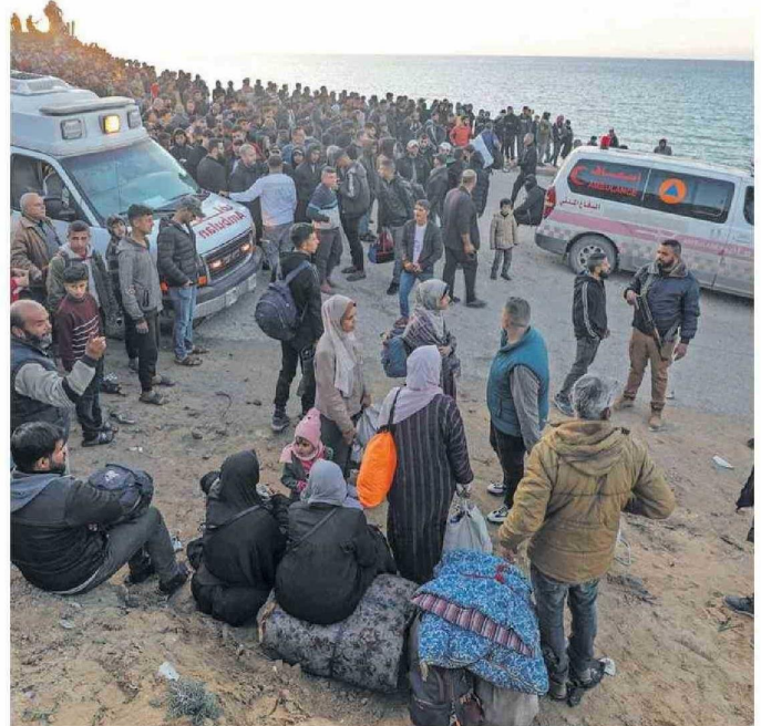
Desplazados palestinos esperan para regresar al norte de la Franja de Gaza desde el sur.

En declaraciones desde el avión presidencial Air Force One, comparó la devastada Franja de Gaza con un "sitio de demolición"