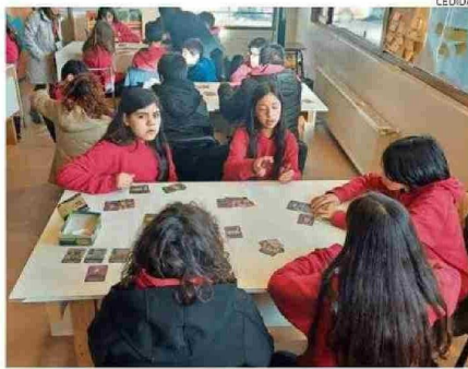
Alumnos del colegio Altamira de Coyhaique probaron el juego.

te que primero logre reunir cuatro "colecciones".