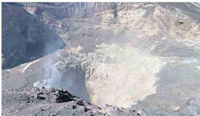
EL VOLCÁN LÁSCAR, EL MÁS ACTIVO DE LA ZONA NORTE, TAMBIÉN FUE ESTUDIADO POR LOS CIENTÍFICOS.

El equipo también destacó la importancia de estudiar estos volcanes de manera con-