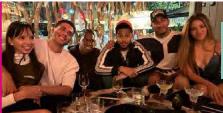
Sentada en una comida junto a Lewis Hamilton.

En su vida también está Winnie Harlow, modelo que brilla en las campañas publicitarias de firmas como Diesel, Desigual, Dior y Tommy Hilffiger y que se caracteriza por usar su vitiligo como característica diferenciadora. Debido a la enfermedad, que causa la pérdida de color de la piel en manchas, enfrentó bullying escolar al recibir el sobrenombre "cebra" o "vacca".