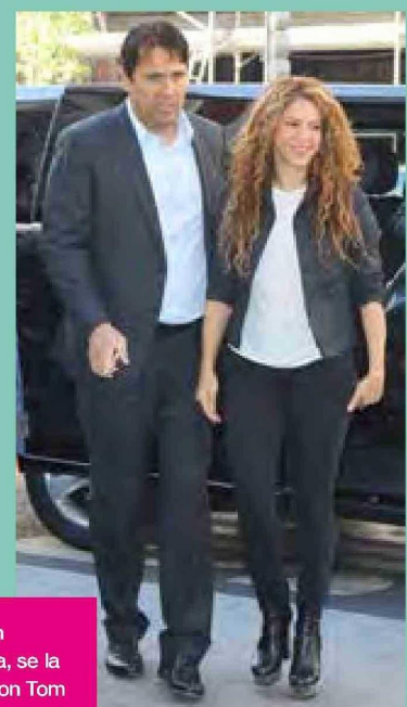
Recién separada, se la asoció con Tom Cruise. Abajo, la cantante con su hermano Tonino.