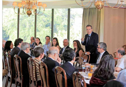
La premiación al Economista del Año 2024, que organiza Economía y Negocios, se realizó ayer en las dependencias de "El Mercurio".