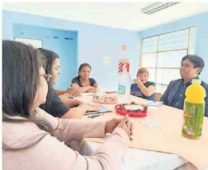
GOBERNADOR REGIONAL SE REUNIÓ CON VECINOS.

autoridad expresó que se quiere recuperar los espacios públicos para las familias. “Queremos una Antofagasta más segura y va-