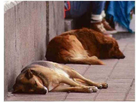
UNA DE CADA CUATRO MASCOTAS EN CHILE NO TIENE DUEÑO.

"Chile es un país en el que proporcionalmente hablando, en términos de número de animales versus cantidad de personas, tenemos una muy alta proporción de animales y eso no sería un problema