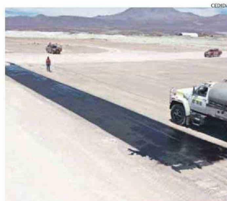
TRABAJOS PARA HABILITAR LA POSADA DE HELICÓPTERO EN OLLAGÜE.