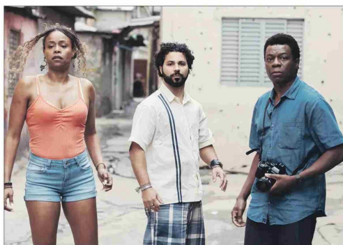
El personaje vuelve a las favelas y registra la violencia.

de la clase social, aprendí que lo que más tienen los brasileños es un problema. La gente se sienta y se abre, llora, habla de sus penas, aficciones, miedos, esperanzas", contó a "Veja".