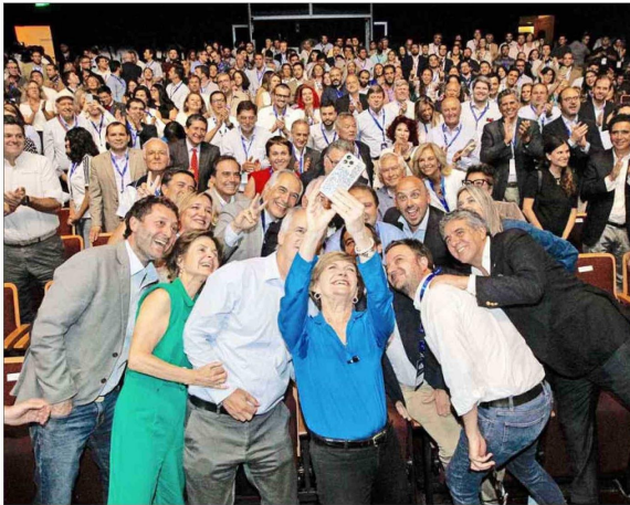
La ya casi obligatoria selfi en un mitin político, con algunos de los presentes, en el acto público más masivo que ha hecho la candidata.