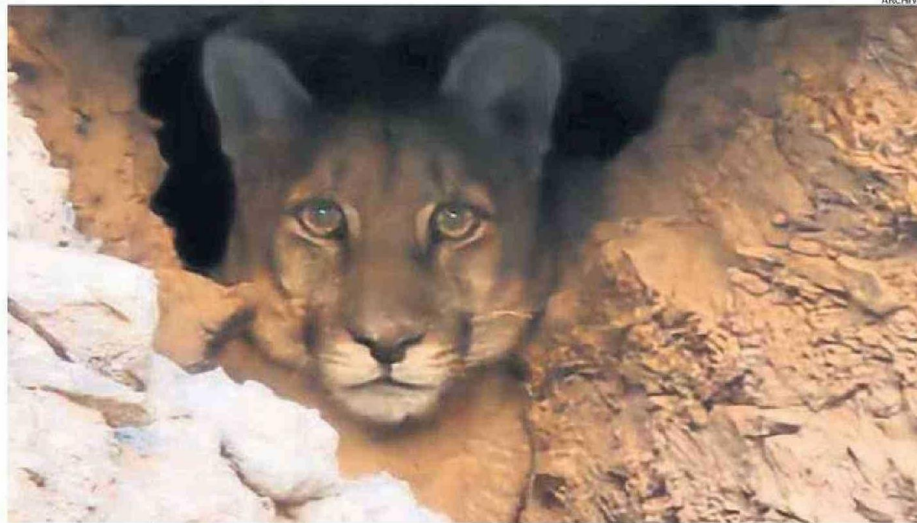
UNA DE LAS TANTAS IMÁGENES DEL AVISTAMIENTO DEL PUMA EN EL LOA, ESTA FUE EN EL SECTOR DE LA QUEBRADA DE AYQUINA EN 2023.