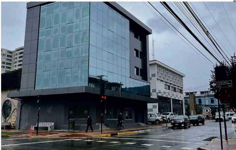
LOS ALUMNOS SERÁN REUBICADOS PROVISORIAMENTE EN LAS INSTALACIONES DEL EX ARAUCANA.