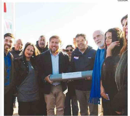
AUTORIDADES Y DIRIGENTES SOCIALES EN LA CEREMONIA EN FREIRINA.

FREIRINA. Con la presencia del ministro Montes colocaron la primera piedra.