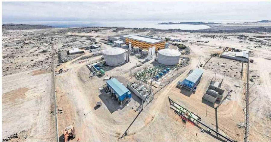
LA PLANTA DESALINIZADORA DE AGUAS CAP ES UNA DE LAS PRIMERAS EN EL PAÍS EN SER MULTIPROPÓSITO