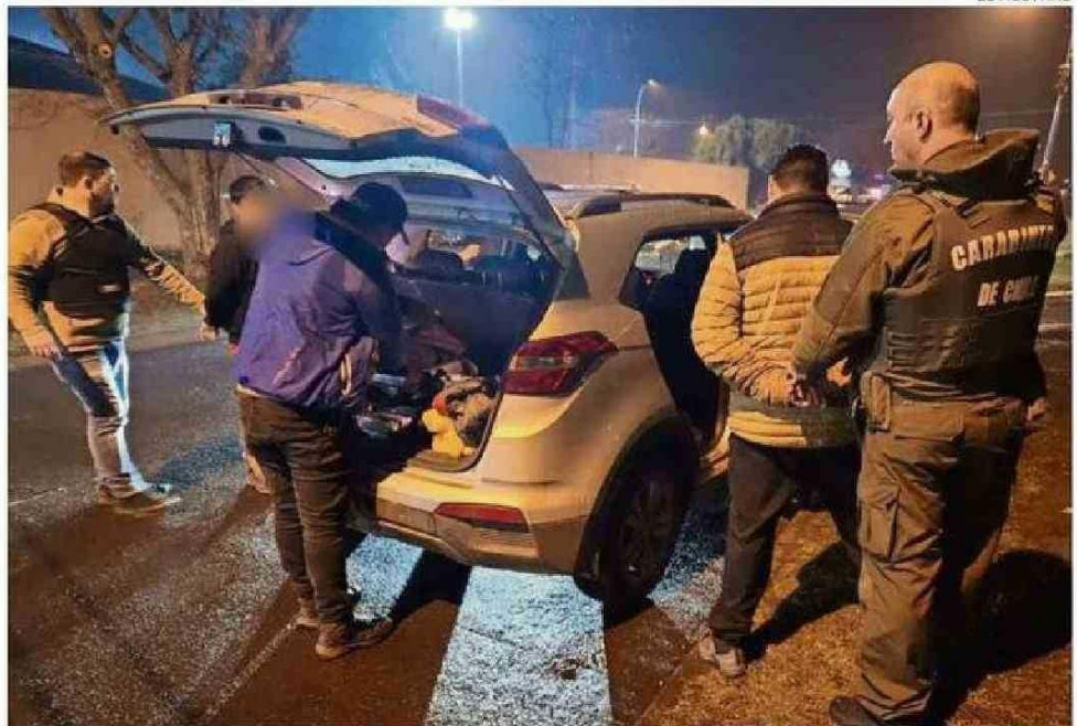
LOS SUJETOS FUERON DESCUBIERTOS RONDANDO EN CALLE ARTURO PÉREZ CANTO Y FUERON DETENIDOS.

Con todo lo anterior, las diligencias permitieron identi-