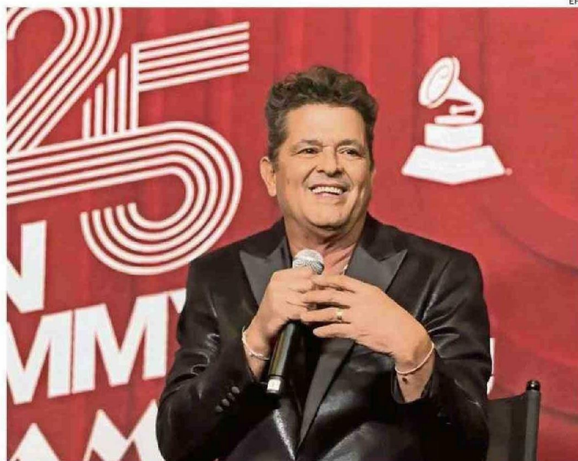
EL MÚSICO CONFIRMÓ SU APARICIÓN EN EL CERTAMEN.

Hasta el momento, se desconoce a los cantantes y comediantes que se presentarán en la Quinta Vergara este 2025, pero, de acuerdo a lo dicho por la animadora Karen Doggenweiler la semana pasada al presen-