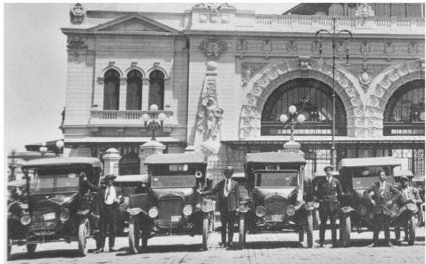
Taxistas de Santiago en 1917.