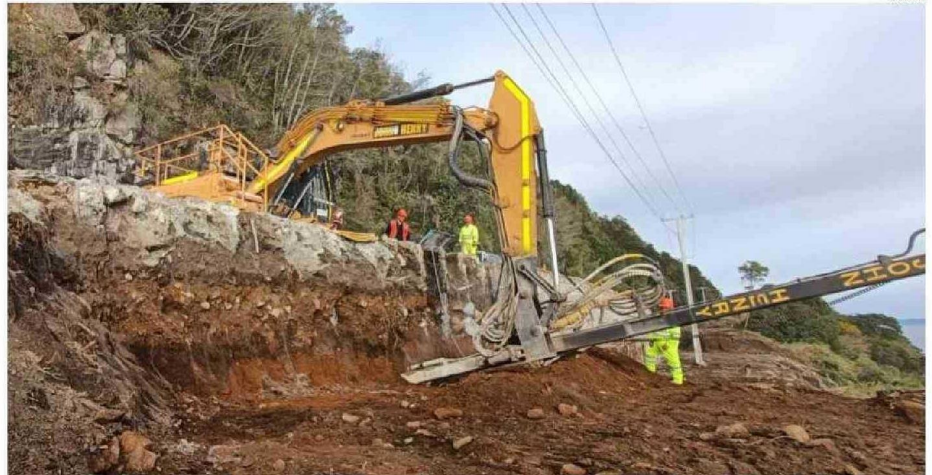
SE CONSTRUYE UN MURO CORTINA DE HORMIGÓN DE SHOTCRETE CON MICROPILOTES, MÁS DOS NIVELES CON PERNOS DE ANCLAJE POSTENSADOS.

Detalló que para su realización se destinó una inversión sectorial que supera los 2.600