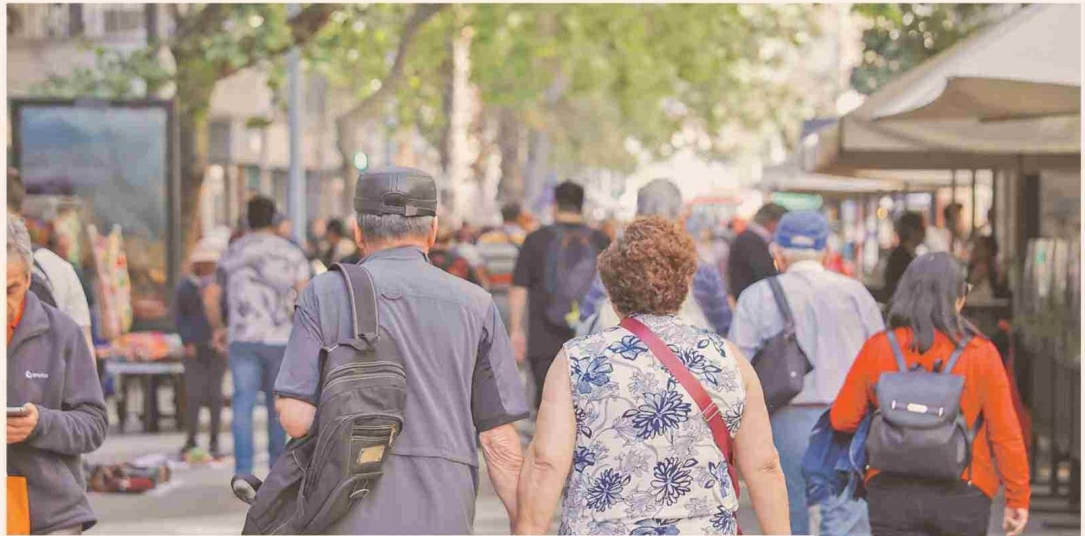
Situación laboral de las personas de 55 años o más

Consultados sobre las barreras que dificultan la contratación de mayores de 55 años, los head hunters mencionaron los prejuicios que existen sobre la capacidad de aprender nuevas habilidades (28%). Más atrás está la dificultad para adaptarse a las nuevas tecnologías (23%) y la preferencia por perfiles más jóvenes (20%).