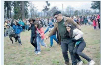
El evento ofrecerá una amplia variedad de actividades típicas, como juegos criollos, un patio de comida, viñas y cervecerías locales.

Al cierre de esta nota, el Centro de Alumnos de la Escuela de Medicina de la Universidad de Valparaíso nos hizo llegar una carta en la que hacen una relación de este y otros casos similares ocurridos en la universidad y en el país, y plantean que "existen muchos antecedentes de abusos en los internados, intentos de suicidios o suicidios, frente a los cuales la universidad debiese actuar como un factor protector frente a esto, pero está siendo el mayor estresor para propiciar estos hechos. Es así como se reitera la necesidad de una ley que nos proteja en los campos clínicos y una ley de salud mental en educación superior".