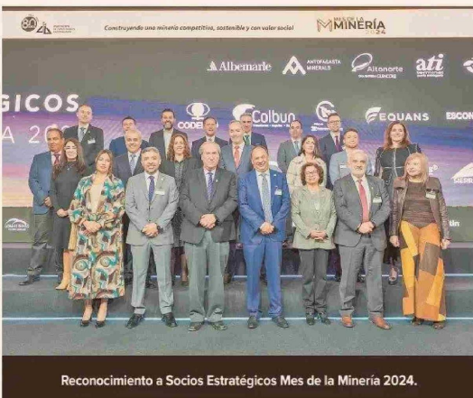
Reconocimiento a Socios Estratégicos Mes de la Minería 2024.