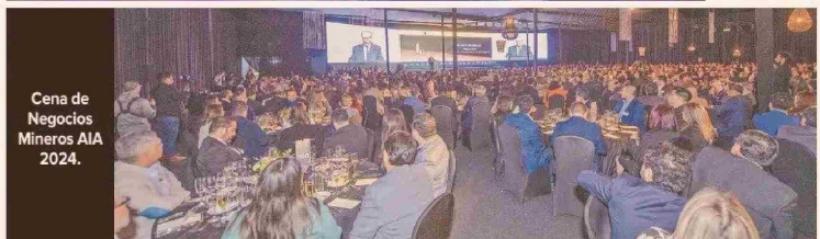
Cena de Negocios Mineros AIA 2024.