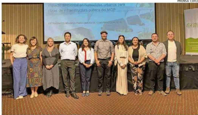
EL EQUIPO DEL CENTRO DE HUMEDALES TRABAJÓ EN LA INICIATIVA PRESENTADA PARA EL MOP.

El estudio consideró el análisis de más de 2 mil contratos de obras del MOP, teniendo en