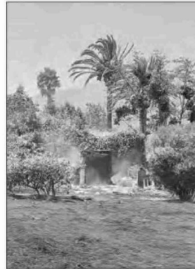
Este es el rucó que habitaban los dos individuos que habrían causado el incendio en las cercanías del Hospital Biprovincial.