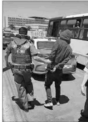
Los dos sujetos se resistieron a la fiscalización antes de ser detenidos por el personal de la Cuarta Comisaría de Carabineros.

Finalmente, el lunes 9 de diciembre, los dos sujetos pasaron a audiencia de control de detención en el Tribunal de Garantía de Quillota, donde el magistrado sometió a ambos a la medida cautelar de firma mensual a contar del próximo 16 de diciembre por todo el tiempo que se extienda la causa, con un plazo indefinido.