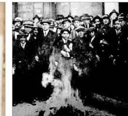
Asalto de la Federación de Estudiantes de la Universidad de Chile (FECh), 1920.