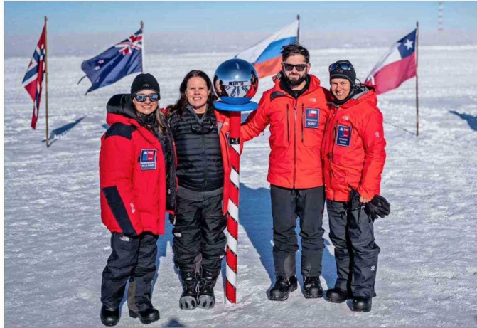
El Presidente Gabriel Boric, junto con la ministra de Defensa, Maya Fernández Allende, y del Medio Ambiente, Maisa Rojas, entre otros integrantes de la comitiva, que fue parte de la reciente visita al Polo Sur.

Ante la controversia, Boric afirmó que “si eso no está solucionado, no se puede hacer la compra, porque en Chile las ins-