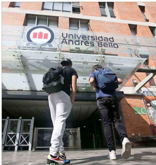
La Universidad Andrés Bello tiene 55 mil alumnos de pregrado, y es la más grande del sistema chileno.

Asegura que la operación forma parte del proyecto de internacionalización de la U. Andrés Bello. “Lamento de verdad las cosas que están pasando en el sistema chileno, universidades a las cuales quiero mucho que están en dificultad”, dice.