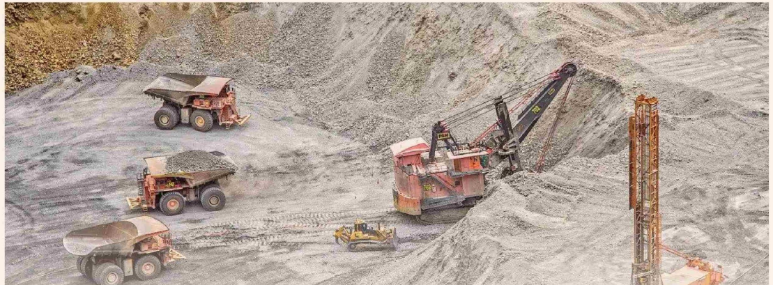
Las mayores transacciones cupríferas 2013-2024