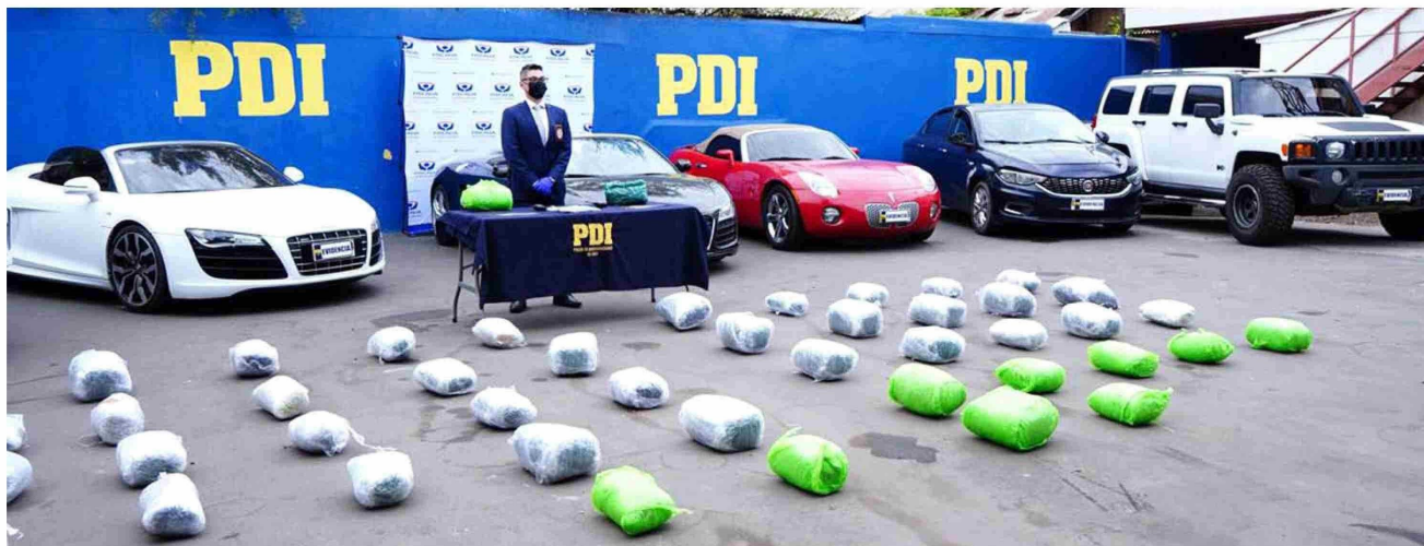
Siete vehículos de alta gama, más de mil kilos de marihuana, armamento y municiones, fueron parte de las especies decomisadas por la Brigada Antinarcoóticos y contra el Crimen Organizado de la PDI en la Región de Coquimbo, en la llamada Operación San Pedro.