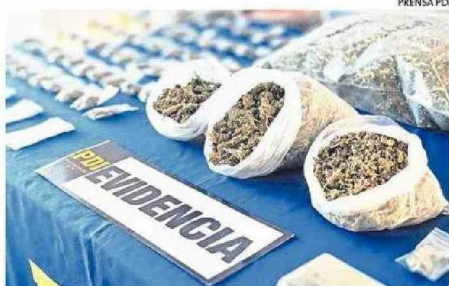
EN LA CERCANÍA DE LA UDEC LOGRARON DETENER A SEIS SUJETOS.

“El tema es que los sujetos que venden drogas se entremezclan con los cabros que llegan acá a vender sus cositas, se sientan y comercializan ahí mismo, desvergonzadamente”, detalló.