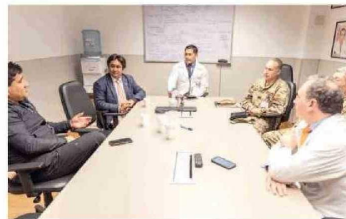
LA PRESENTACIÓN DEL CONVENIO SE REALIZÓ AYER.