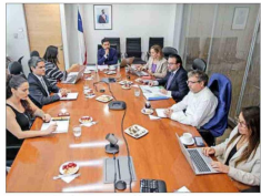
Por casi dos horas sesionó la instancia, compuesta por seis autoridades que sustituyeron a los titulares.

"Subrogantes" de ministros Comité del Gobierno vota nuevamente en contra de Dominga: uno de sus integrantes ya se había opuesto al proyecto minero