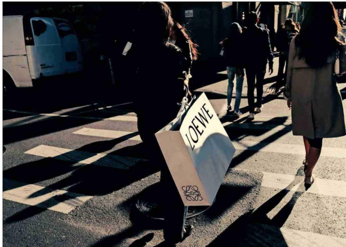
El 10% de los que más ganan representa el 49,7% del gasto total.

El 10% de los estadounidenses con mayores ingresos ha aumentado su desembolso muy por sobre la inflación. El resto no lo ha hecho.