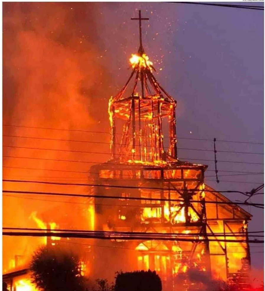
AQUELLA MAÑANA DEL 22 DE ENERO DE 2020 SE MARCÓ UN ANTES Y UN DESPUÉS EN EL PATRIMONIO CULTURAL ANCUDITANO.

Las pérdidas fueron significativas. "Además de mobiliario -detalla el párroco-, algunas imágenes que eran del año 1800. Hay un Cristo, sobre todo, que era el Cristo que estaba sobre el altar, que era muy antiguo y que venía de la vieja escuela chilota y algunos cuadros, y todo lo que implica la imagi-