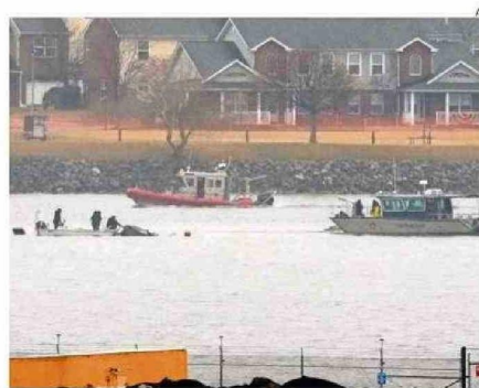
MIEMBROS DE EQUIPOS DE RESCATE AÚN BUSCAN A 14 DESAPARECIDOS.