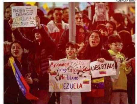
UN GRAN NÚMERO DE VENEZOLANOS PODRÁ VOTAR EN OCTUBRE.