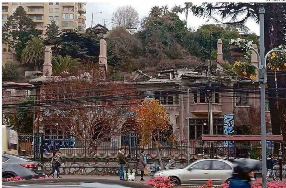
ENTRE LAS PRINCIPALES OBSERVACIONES HECHAS ESTÁ ATENDER LA FALTA DE CUBIERTA DEL INMUEBLE.